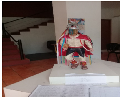
Danza de los Moros