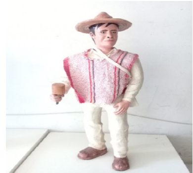
Danza de los Juan Dieguitos