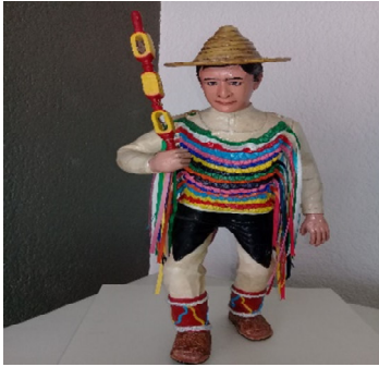
Danza de Sonajeros