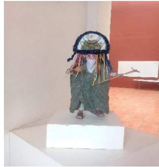
Danza de Paixtles