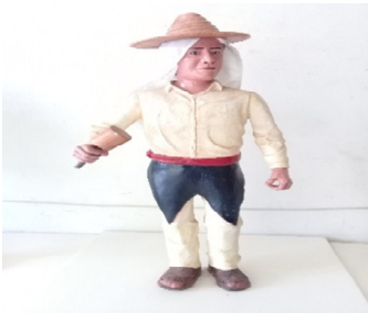
Danza de Negritos