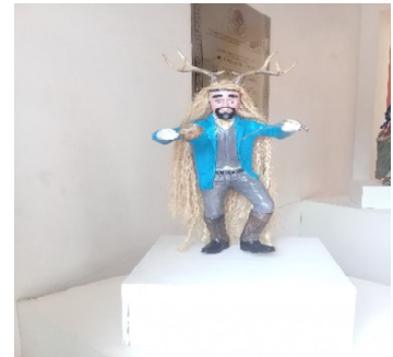
Danza de Chayacates