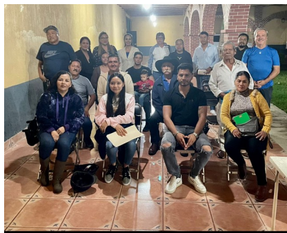
31 agosto 2023 capacitacion del Consejo municipal de Participacion Ciudadana.