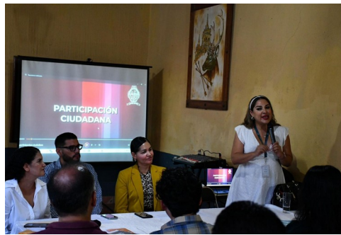
5 de julio 2023 toma de protesta del consejo municipal de Participacion Ciudadana.