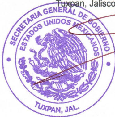
LIC. VICENTE PINTO RAMÍREZ SECRETARIO GENERAL

"2023, Año del Bicentenario del Nacimiento del Estado Libre y Soberano de Jalisco" Tuxpan, Jalisco, Pueblo de la Fiesta Eterna, a 24 de agosto del 2023.