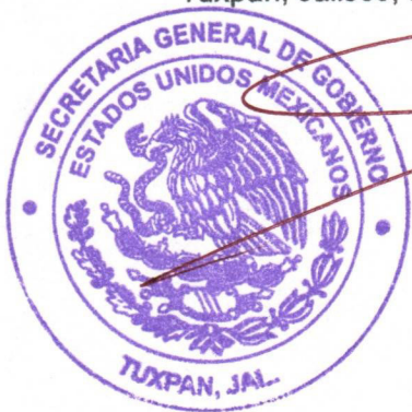
LIC. VICENTE PINTO RAMÍREZ SECRETARIO GENERAL

"2023, Año del Bicentenario del Nacimiento del Estado Libre y Soberano de Jalisco" Tuxpan, Jalisco, Pueblo de la Fiesta Eterna, a 24 de agosto del 2023.