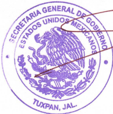
LIC. VICENTE PINTO RAMÍREZ SECRETARIO GENERAL

"2023, Año del Bicentenario del Nacimiento del Estado Libre y Soberano de Jalisco" Tuxpan, Jalisco, Pueblo de la Fiesta Eterna, a 24 de agosto del 2023.